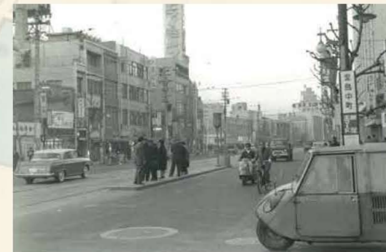
昭和33年の堂島中町