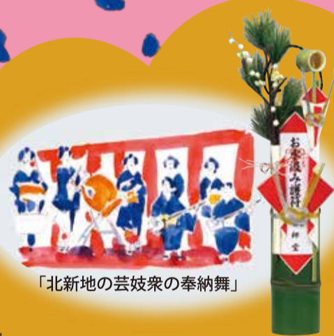
「北新地の芸妓衆の奉納舞」